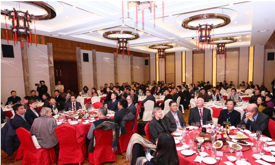
Abendessen beim Jahrestreffen

Text: Sabine Porsche, GIZ Übersetzung: Sun Jiahe, GIZ