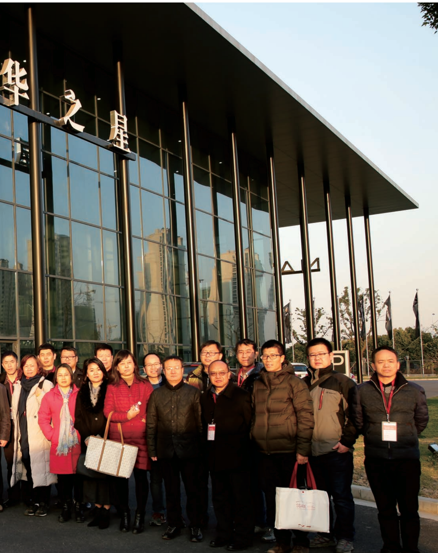
Schulleiter vor dem Mercedes-Benz Dealership