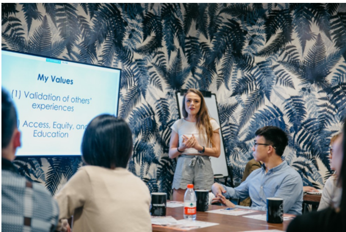
Der Bosch-Lehrstuhl für Global Supply Chain Management organisierte eine